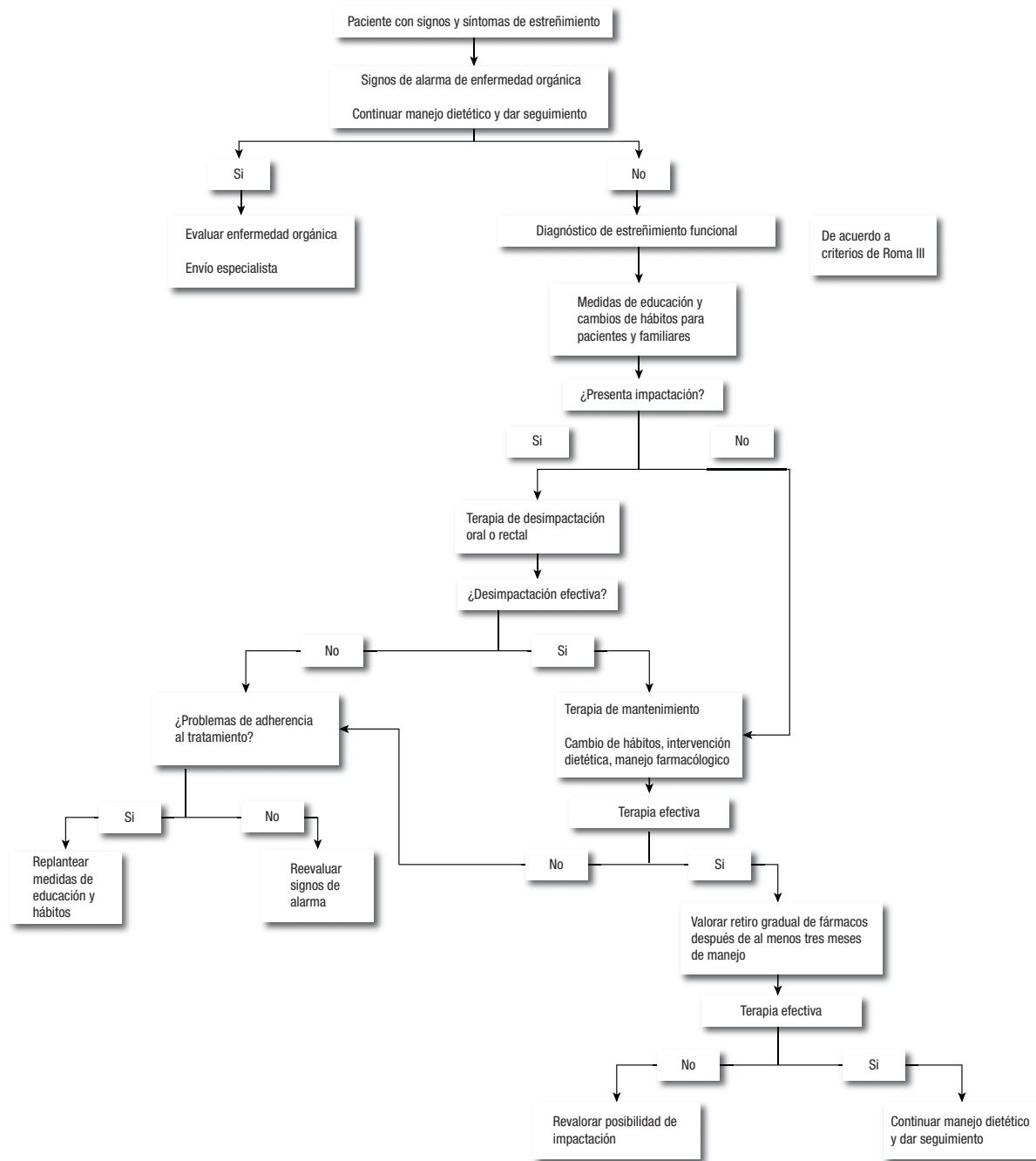
■ Figura 2. Algoritmo de diagnóstico y tratamiento en estreñimiento crónico en niños mayores de un año de edad.